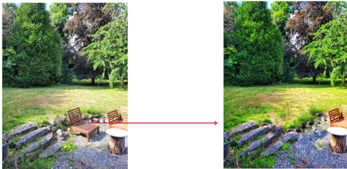
Suppression d'un élément via l'outil "Correction"

L'étape suivante vous permettra d'accéder à toutes sortes de fonctionnalités, à travers l'onglet "outils". Une multitude de choix s'offrent à vous : du recadrage à la balance des blancs, en passant par l'ajout d'effets vintage, de cadres, de textes mais aussi à l'outil "correction", vous permettant par exemple d'effacer un détail de la photo qui vous semblerait superflu.